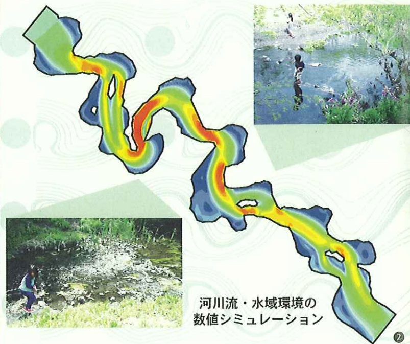
河川流・水域環境の数値シミュレーション